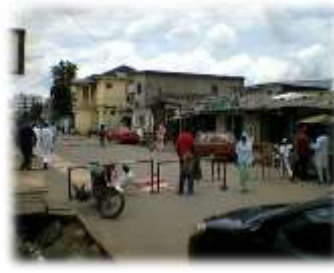
Figure 1 et 2 : Préparatifs pour la prière et prière de rue au quartier New-Bell à Douala (mosquée, maison en carreaux blancs).

Le religieux semble prendre en otage les autres champs d'activités. Pendant les moments de prière, il se met au-dessus de toutes