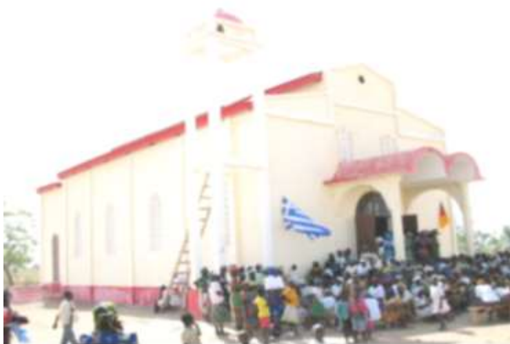
Figure 8 : Inauguration l'Église Orthodoxe Grecque à l'Extrême Nord-Cameroun, avec le flottement des drapeaux des États grec et camerounais.

disséminées dans la région de l'Adamaoua, le Mayo Danay, le Mayo Kani ou le Mayo Tsanaga. Néanmoins, les informations de ce tableau confirment le déploiement tous azimuts de l'Église Grecque orthodoxe au Nord-Cameroun. Á croire que le clergé de cette Église a réellement pris conscience de la nécessité de mieux « vendre » le message religieux orthodoxe dans le pays seulement après l'amorce des années marquants le début du 21 ème siècle. Les deux photographies ci-dessus permettent par exemple, d'apprécier l'architecture de l'église grecque au Nord-Cameroun.