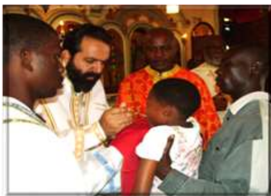
Figure 3 : Cérémonie de baptême à l'église d'Annonciation de la Vierge à Yaoundé présidé par un prêtre orthodoxe grec sous le regard des prélats camerounais.

On comprend alors mieux pourquoi depuis quelques décennies, la nouvelle mission religieuse assignée à ces hommes de Dieu est, de manière globale, de procéder à la propagation de l'orthodoxie dans les quatre coins du Cameroun et en Afrique centrale en vue de développer définitivement la foi orthodoxe auprès des populations africaines (Gregorios, 2009 : 10-15). Pour y parvenir, l'Église Grecque Orthodoxe ne fait pas/plus l'économie de la formation et du recrutement des prêtres africains et notamment camerounais depuis le milieu des années 1980. On assiste ainsi à une « camerounisation » progressive du clergé sous les bons auspices des pasteurs grecs. À preuve, sur la trentaine de prêtres que compte l'Église Orthodoxe Grecque au Cameroun en 2009, 27 sont originaires du Cameroun, ce qui témoigne de la forte présence des pasteurs locaux au sein du clergé orthodoxe dans le pays (Gregorios, 2009 : 10).