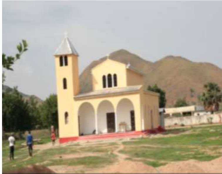
Figure 9 : La majestueuse paroisse Saint Achilios à Maroua, érigée au pied d'une colline.

À bien observer, on constate que l'Église Orthodoxe Grecque a cessé d'être seulement un lieu de culte. Sans vouloir faire de comparaison avec ses homologues catholiques et protestantes qui sont ancrées dans le domaine scolaire de manière très avancée (écoles de référence, centre de formation ou instituts universitaires internationaux), on note tout de même que l'Église hellénique s'investit aussi progressivement dans le secteur social, notamment dans la construction des centres de santé, la formation des jeunes, l'octroi des dons de diverses natures, etc.