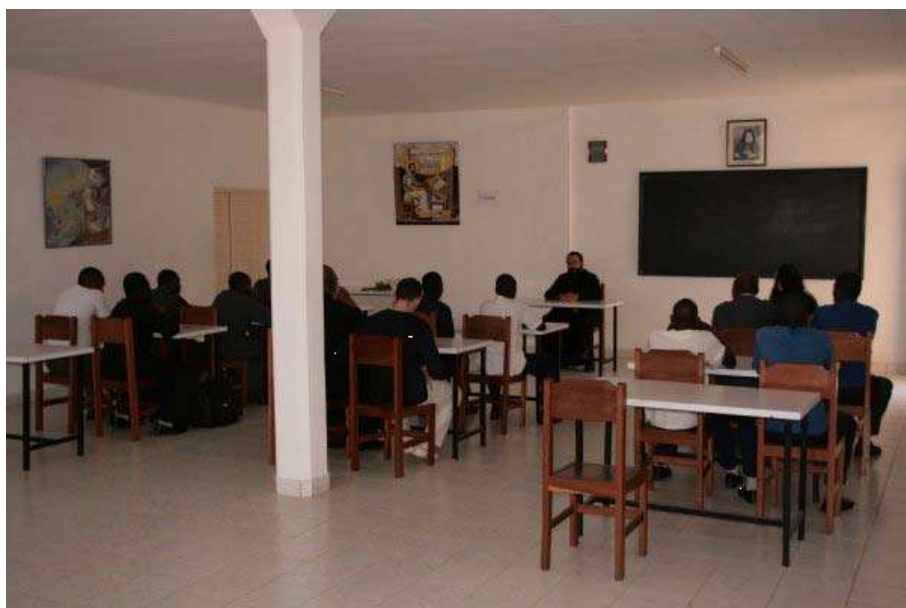
Figure 4: Séminaristes d'Afrique centrale au Séminaire de théologie « Hagios Markos » à Yaoundé.

À travers les photographies n°3 et n°4, on ne saurait nier les changements initiés dans la formation et la responsabilisation d'un clergé local au sein de l'institution orthodoxe au Cameroun. Mais si tel est le cas, quid des foyers de concentration de cette Église dans le pays ?