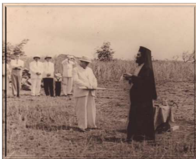
Figure 1 : Pose de la première pierre pour la construction de la cathédrale l'« Annonciation de la Mère de Dieu » au quartier Bastos à Yaoundé en 1953.

Toutefois, il faut noter que cette première décision du Haut-commissaire n'était que le prélude à la création des missions orthodoxes au Cameroun colonial. Car, c'est en 1953 que la décision la plus importante fut signée par les autorités françaises, autorisant définitivement la pratique du culte orthodoxe dans l'ensemble des territoires du Cameroun et du Togo, deux territoires placés sous la tutelle de l'État colonial français (Ibid.) : c'est le lancement des travaux de construction des premiers temples orthodoxes dans les grandes villes de la colonie (voir photographie n°1 et n°2).