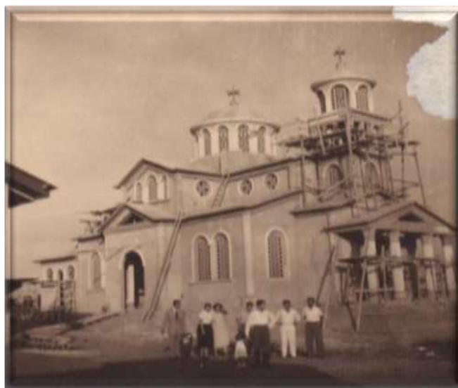
Figure 2: Travaux de construction de la cathédrale de l'Annonciation de la Mère de Dieu à Yaoundé en 1955. Source : Gregorios, (2009 : 12).

En un mot, la constitution de la communauté est généralement le cadre idéal de construction et d'éclosion des Églises de la diaspora grecque. La construction d'une église orthodoxe qui est un véhiculeur de l'identité hellène est donc, à plus d'un titre, tributaire de l'organisation communautaire au sein de la diaspora hellénique (Akono Abina, 2008 : 85-87).